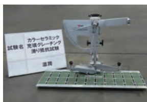
振り子式スキットレジスタンステストによるすべり試験