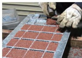
スベランカラー石詰め工程

セラミック材を広く充填することにより全体がタイル調に見え、景観に溶け込みやすく盗難を抑止します。